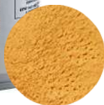
DG6448. ВЕЛЬВЕТ оранжевый, 400 мл