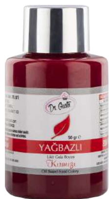
DG6961. КРАСНЫЙ, 50 г