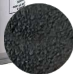
DG6455. ВЕЛЬВЕТ черный, 400 мл