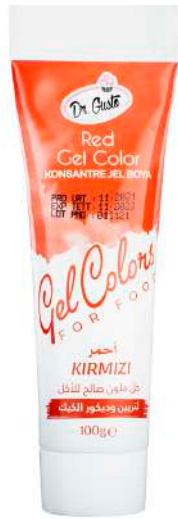
DG6718. КРАСНЫЙ, 100 г