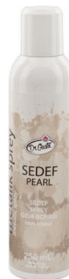
DG8118. Спрей ЖЕМЧУЖНЫЙ, 250 мл