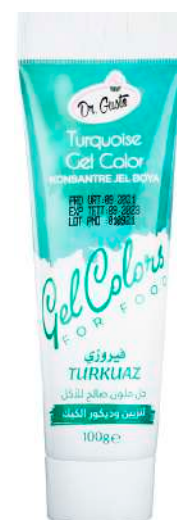
DG5403. БИРЮЗОВЫЙ, 100 г