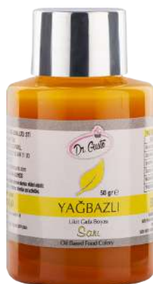
DG6978. ЖЕЛТЫЙ, 50 г