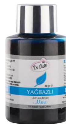
DG6992. СИНИЙ, 50 г