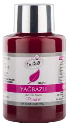
DG7005. РОЗОВЫЙ, 50 г