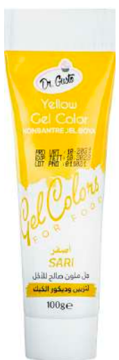
DG6732. ЖЕЛТЫЙ, 100 г