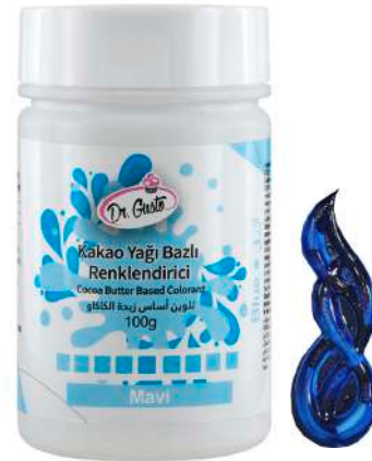
DG5625. СИНИЙ, 100 г