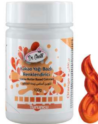
DG5663. ОРАНЖЕВЫЙ, 100 г