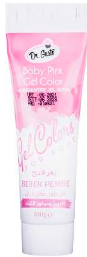
DG6770. НЕЖНО- РОЗОВЫЙ, 100 г