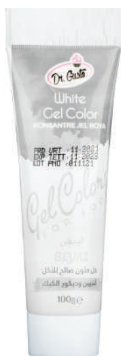
DG6794. БЕЛЫЙ, 100 г