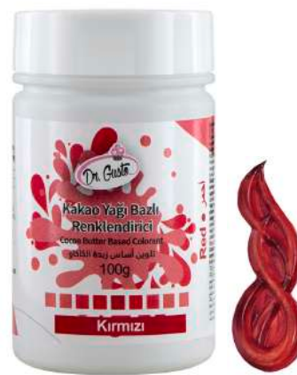
DG5595. КРАСНЫЙ, 100 г