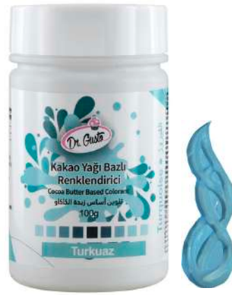
DG5700. БИРЮЗОВЫЙ, 100 г