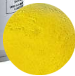
DG6394. ВЕЛЬВЕТ желтый, 400 мл