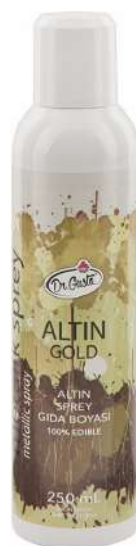
DG0860. Спрей ЗОЛОТО, 250 мл