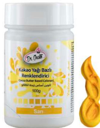
DG5601. ЖЕЛТЫЙ, 100 г