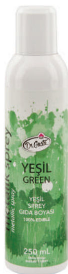
DG0891. Спрей ЗЕЛЕНый, 250 мл