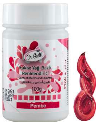
DG5632. РОЗОВЫЙ, 100 г