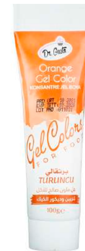
DG6800. ОРАНЖЕВЫЙ, 100 г