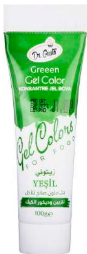
DG6749. ЗЕЛЕНый, 100 г