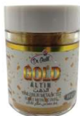
DG7500. Металлизированный ЗОЛОТО, 10 г