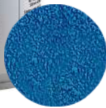
DG6417. ВЕЛЬВЕТ синий, 400 мл