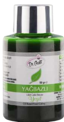
DG6985. ЗЕЛЕНый, 50 г