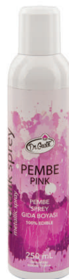
DG0914. Спрей РОЗОВый, 250 мл