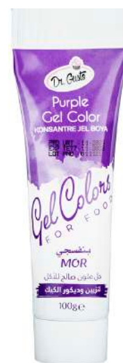
DG6763. ФИОЛЕТОВЫЙ, 100 г