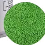
DG6400. ВЕЛЬВЕТ зеленый, 400 мл