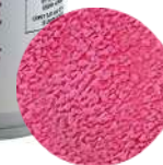
DG6424. ВЕЛЬВЕТ розовый, 400 мл