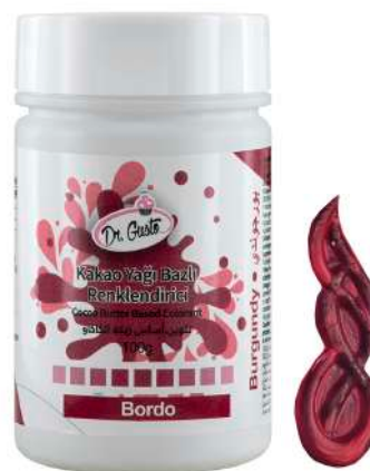
DG5656. БОРДОВЫЙ, 100 г