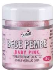
DG3656. Металлизированный НЕЖНО-РОЗОВЫЙ, 10 г