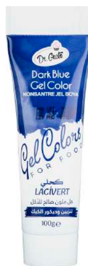
DG6855. ТЕМНО- СИНИЙ, 100 г