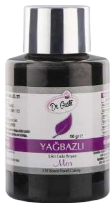
DG7012. ФИОЛЕТОВЫЙ, 50 г