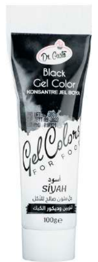
DG6787. ЧЕРНЫЙ, 100 г