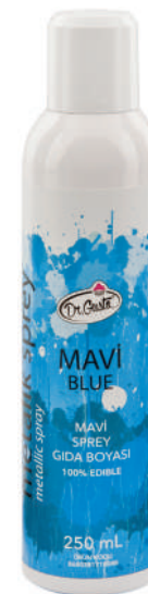
DG8088. Спрей СИНИый, 250 мл