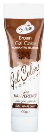
DG6862. КОРИЧНЕВЫЙ, 100 г