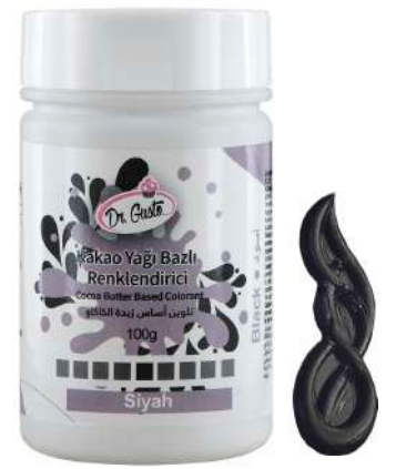
DG5670. ЧЕРНЫЙ, 100 г