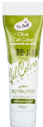
DG5397. ОЛИВКОВЫЙ, 100 г