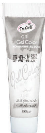
DG6817. СЕРЫЙ, 100 г