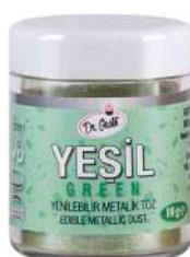
DG7913. Металлизированный ЗЕЛЕНый, 10 г