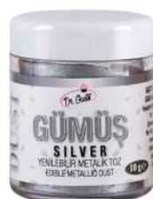
DG7517. Металлизированный СЕРЕБРО, 10 г