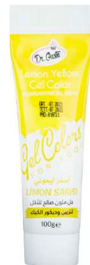
DG6879. ЛИМОННО- ЖЕЛТЫЙ, 100 г