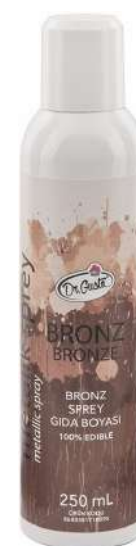
DG8095. Спрей БРОНЗА, 250 мл