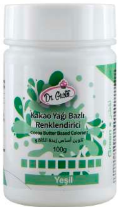
DG5618. ЗЕЛЕНЬКИЙ, 100 г