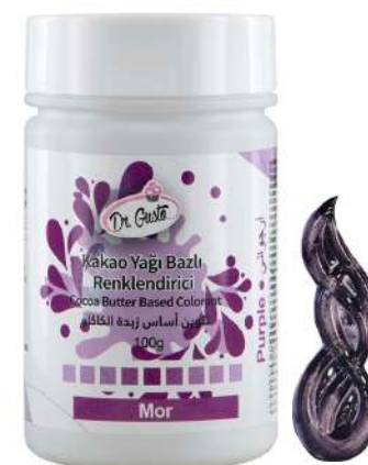
DG5649. ФИОЛЕТОВЫЙ, 100 г