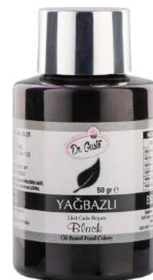
DG3151. ЧЕРНЫЙ, 50 г