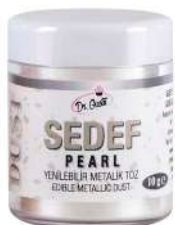
DG7876. Металлизированный ЖЕМЧУЖНЫЙ, 10 г