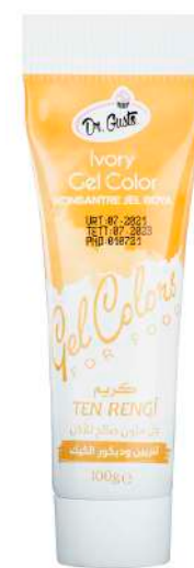
DG6831. ТЕЛЕСНЫЙ, 100 г