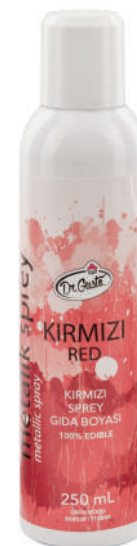
DG0884. Спрей КРАСНый, 250 мл