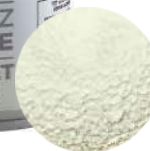
DG6462. ВЕЛЬВЕТ белый, 400 мл