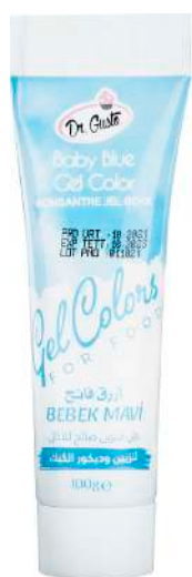
DG6756. НЕЖНО- ГОЛУБОЙ, 100 г