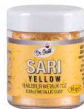
DG1207. Металлизированный ЖЕЛТЫЙ, 10 г