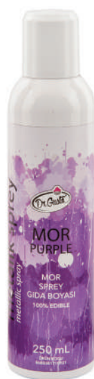
DG0921. Спрей ФИОЛЕТОВый, 250 мл