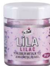
DG1283. Металлизированный СИРЕНЕВЫЙ, 10 г