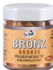
DG1368. Металлизированный БРОНЗА, 10 г