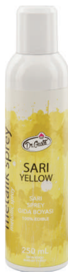
DG0907. Спрей ЖЕЛТый, 250 мл