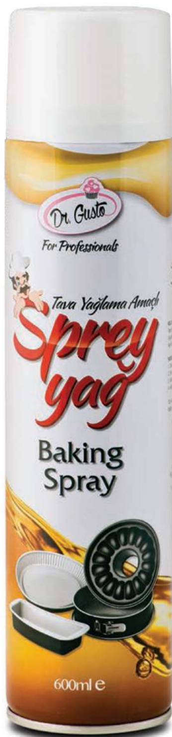
DG3601. Жир-спрей для смазки, 600 мл СКОРО