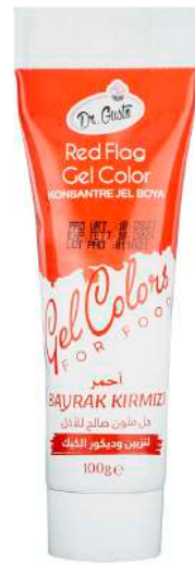
DG6725. КРАСНОЕ ЗНАМЯ, 100 г