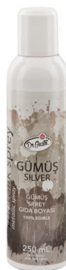
DG0877. Спрей СЕРЕБРО, 250 мл