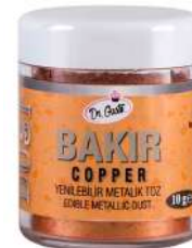
DG7869. Металлизированный МЕДЬ, 10 г