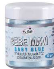
DG3205. Металлизированный НЕЖНО-ГОЛУБОЙ, 10 г