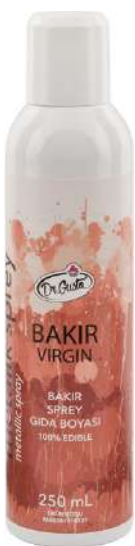
DG8101. Спрей МЕДЬ, 250 мл