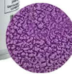
DG6431. ВЕЛЬВЕТ фиолетовый, 400 мл