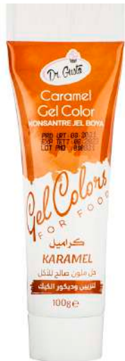
DG5380. КАРАМЕЛЬНЫЙ, 100 г