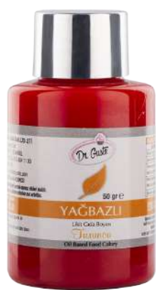
DG7029. ОРАНЖЕВЫЙ, 50 г