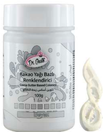
DG5687. БЕЛЫЙ, 100 г