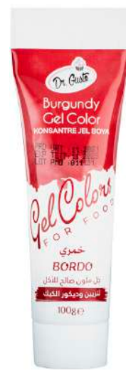
DG6886. БОРДОВЫЙ, 100 г