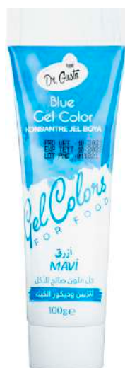
DG6824. СИНИЙ, 100 г