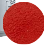
DG6387. ВЕЛЬВЕТ красный, 400 мл