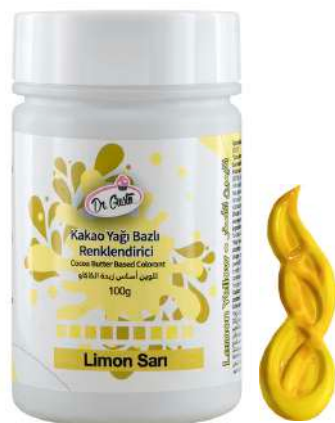
DG5694. ЛИМОННО-ЖЕЛТЫЙ, 100 г