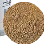
DG6479. ВЕЛЬВЕТ коричневый, 400 мл