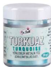
DG3687. Металлизированный БИРЮЗОВЫЙ, 10 г