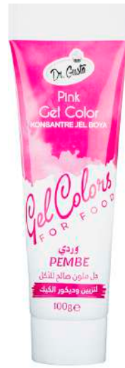
DG6848. РОЗОВЫЙ, 100 г