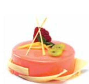
Глазурь Мируар Клубника