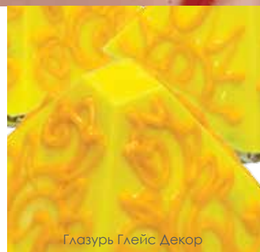
Глазурь Глейс Декор