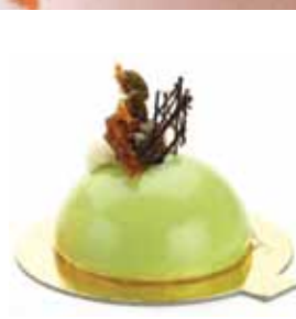
Глазурь Мируар Фисташка