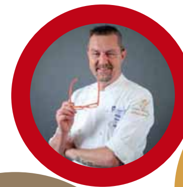
Filippo Novelli Известный Шеф-кондитер